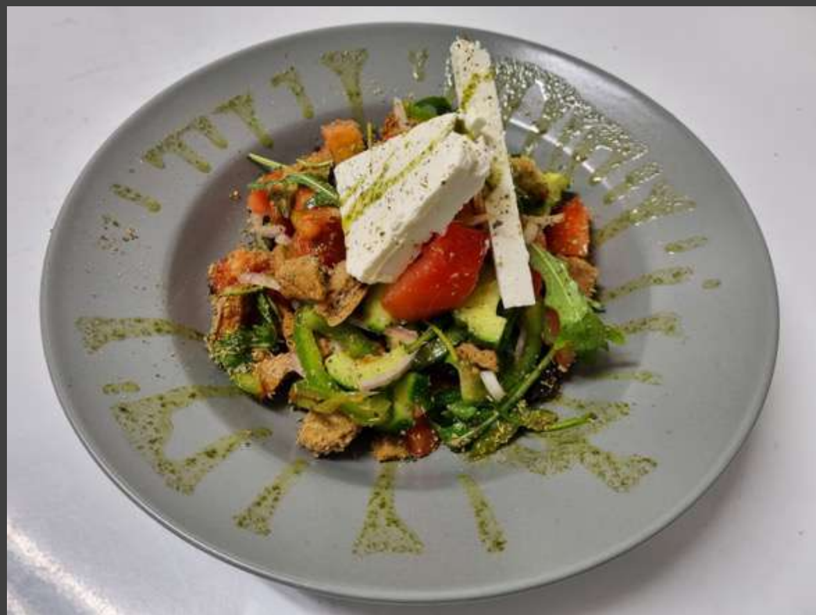
Horiatiki with Cretan Rusks, feta and olives