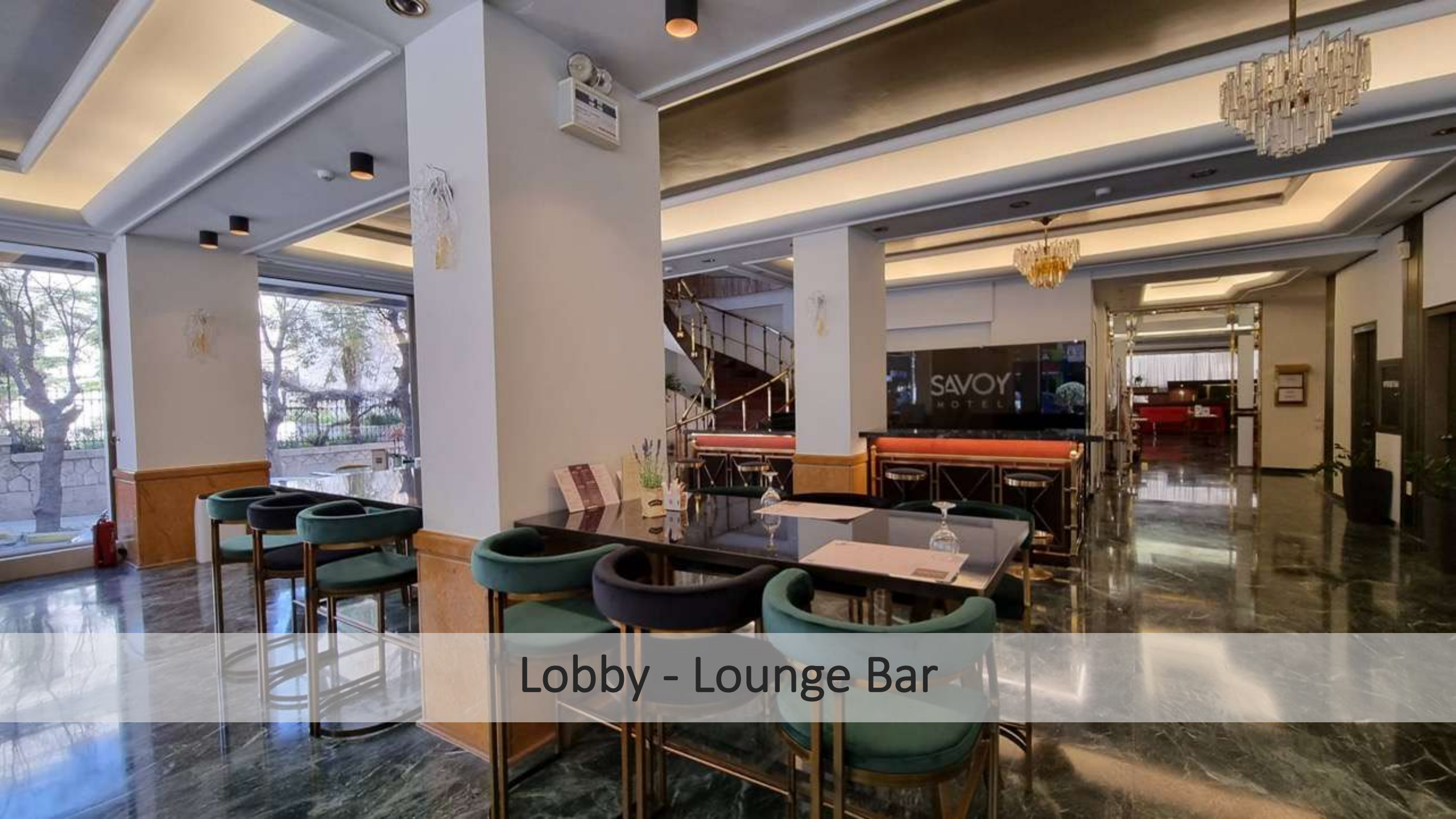
Lobby - Lounge Bar