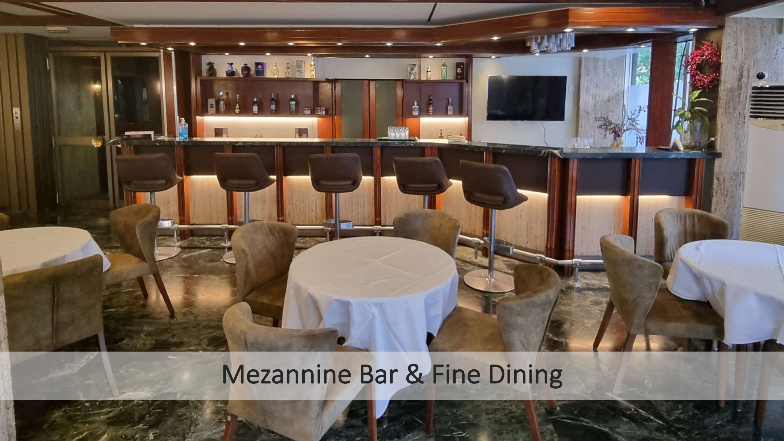
Mezannine Bar & Fine Dining