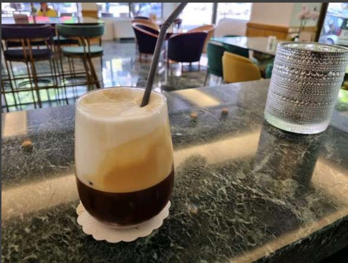
Freddo Espresso (Illy Coffe)