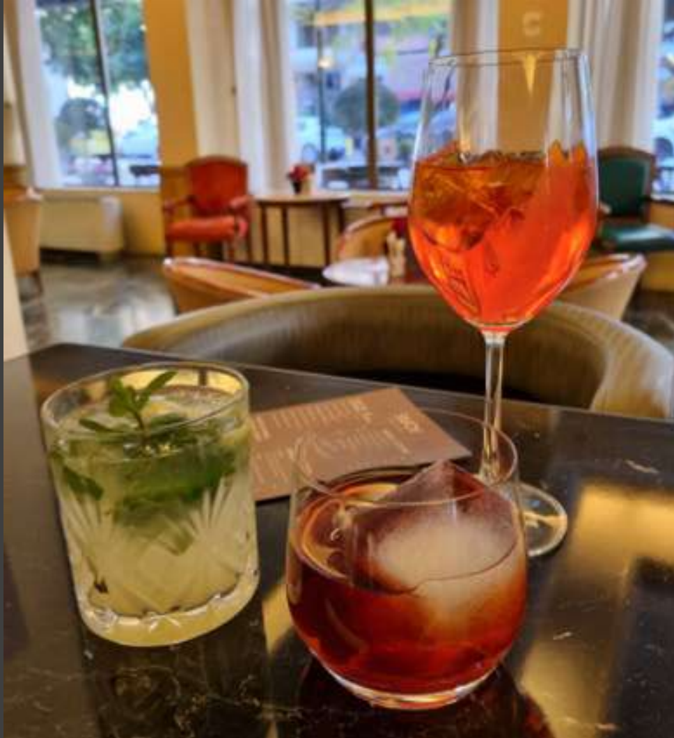
Mohito ▲ Negroni ▲ Aperol Spritz