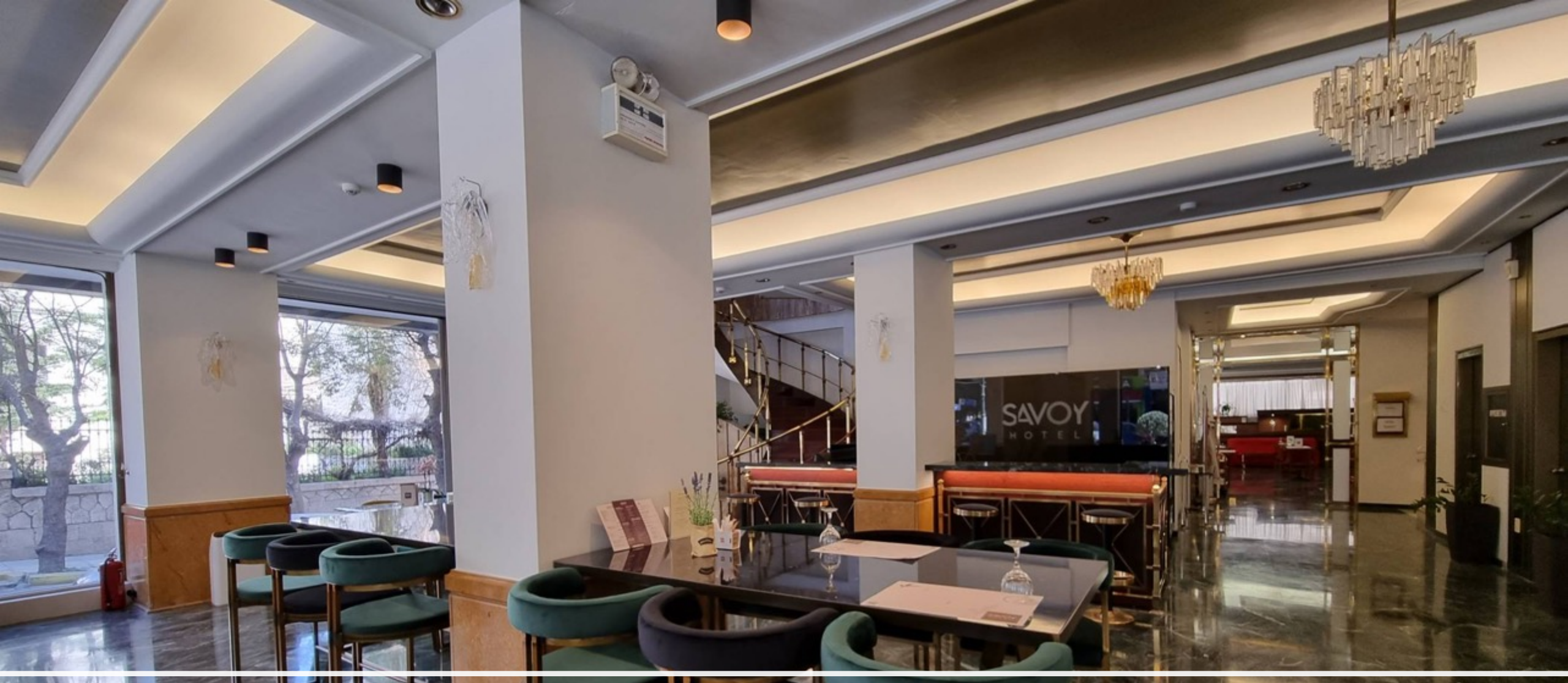
Lobby Lounge Bar