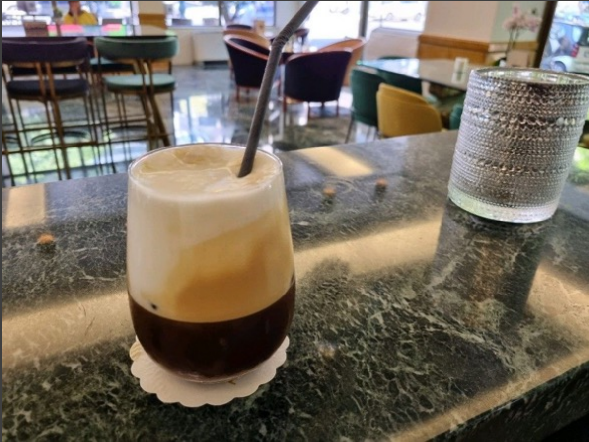
Freddo Espresso (Illy Coffe)