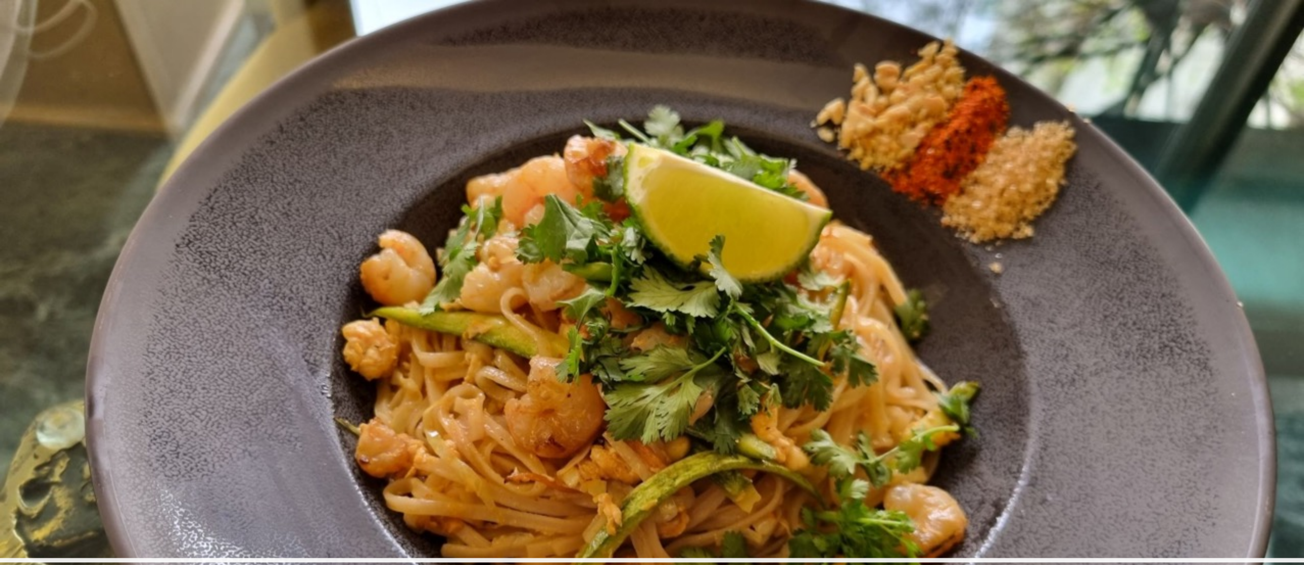
Pad Thai Shrimp