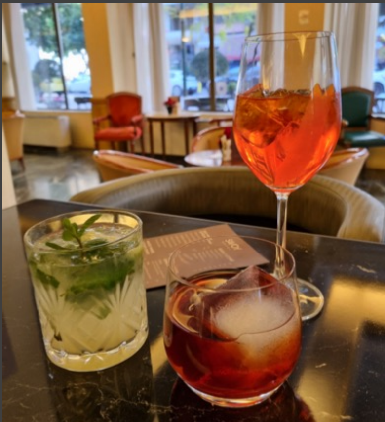
Mohito Negroni Aperol Spritz