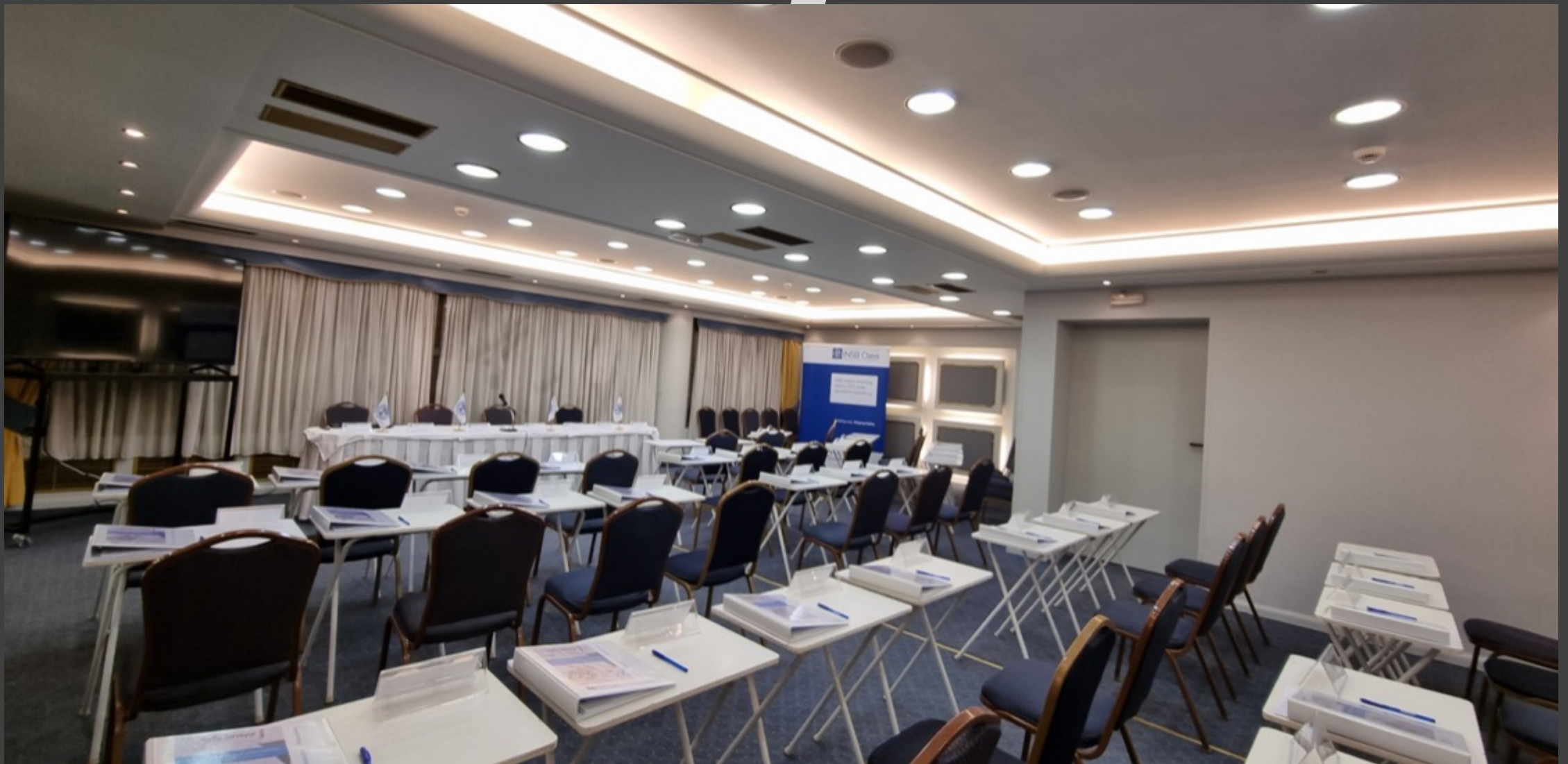
Savoy Hotel Conference & Seminar facilities