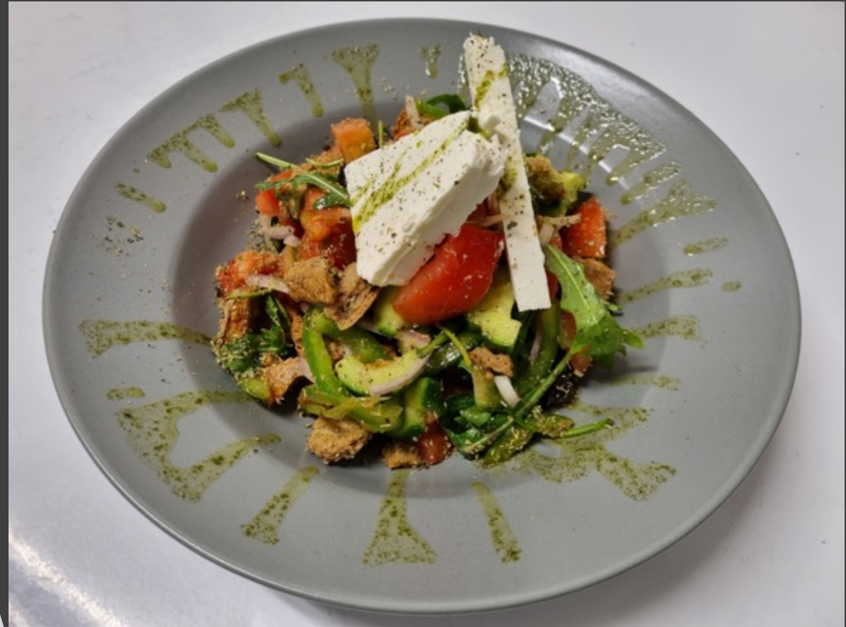
Horiatiki with Cretan Rusks, feta and olives